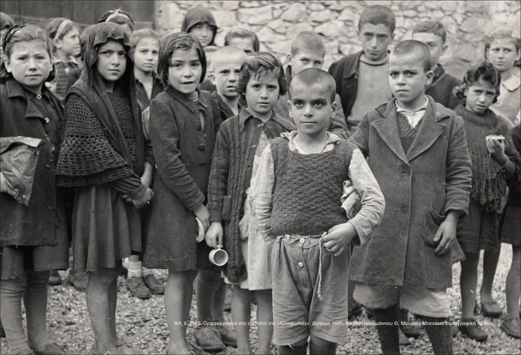
ΦΑ_6_1165. Ορφανά παιδιά στο σύσταιτο της «Αετοφωλιάς». Δίστομο 1945